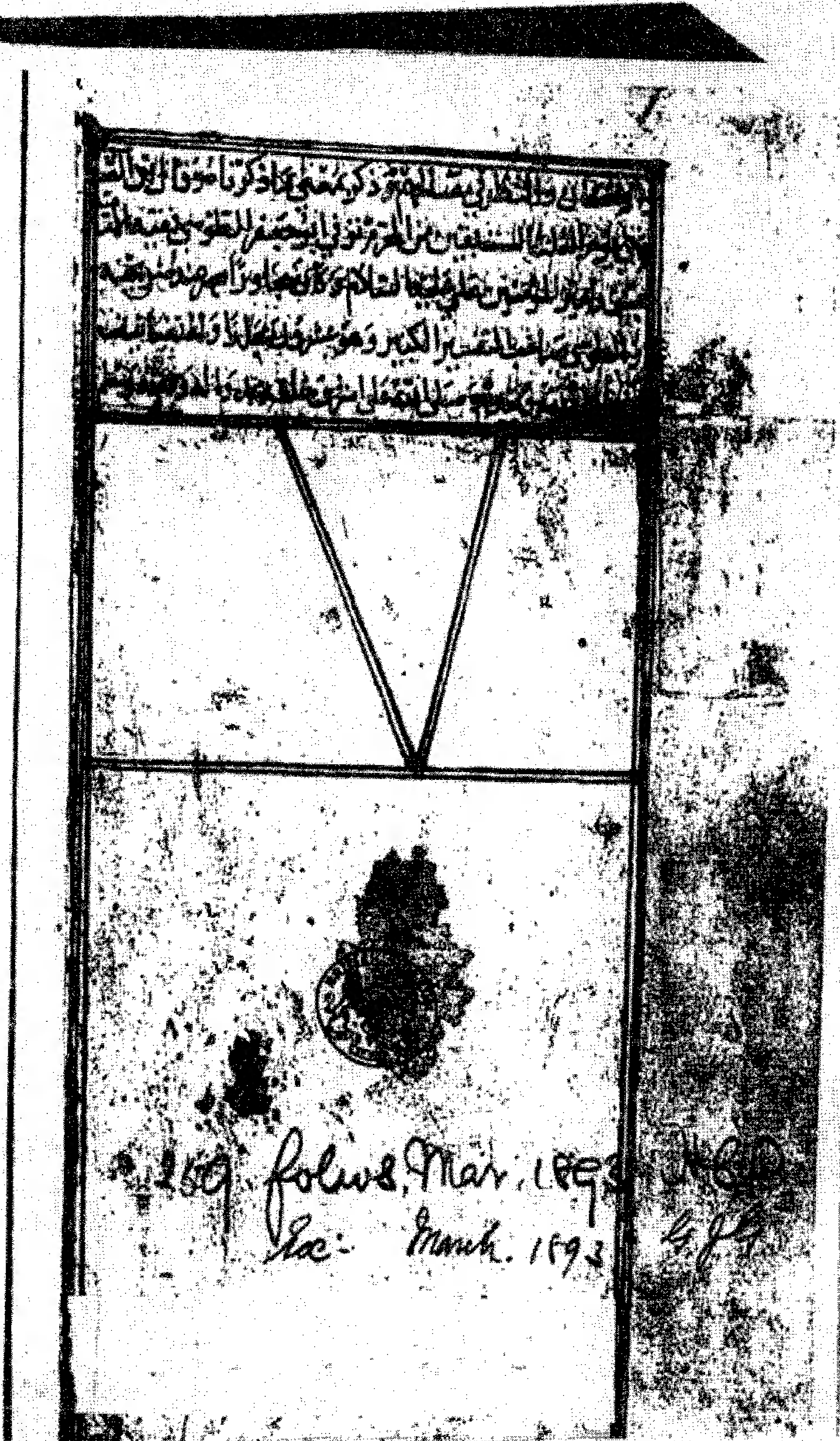
الصفحة الأخيرة من نسخة المتحف البريطاني